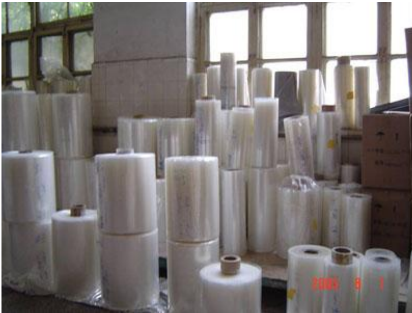
图三：所生产的各种多层共挤食品及医用包装复合膜