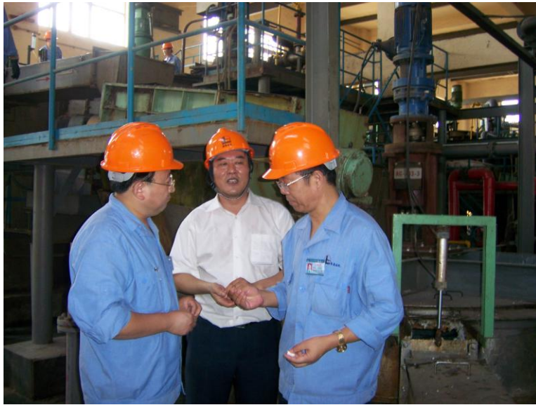
图八：在齐鲁石化橡胶厂进行“丁苯橡胶/纳米层状硅酸盐乳液共沉胶”工业化试验现场（年五万吨装置）照片