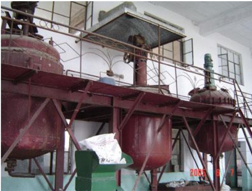
图七：2000 吨/年纳米层状硅酸盐生产装置

标志性成果四： 与中石化齐鲁石化橡胶厂合作开发的“丁苯橡胶/纳米层状硅酸盐乳液共沉胶”已完成工业化试验（国内首家），其成功不仅可产生巨大的经济效益（国内丁苯橡胶产量为 60 万吨），而且将有望彻底根除污染、节约石油等战略物资。见图七、八、九。