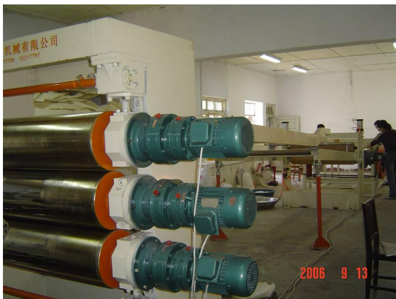
图四：所研制的聚丙烯发泡板材生产线

标志性成果三： 聚丙烯发泡材料是拟在已有的专利技术的基础上，与重庆长安集团、青岛喜盈门集团等合作逐步形成从原材料改性到产品制备的整体产业化链技术，填补国内空白。见图四、五、六。