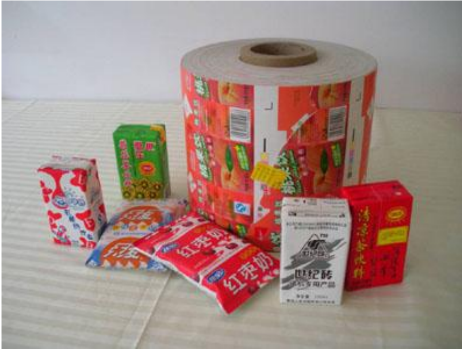
图一：所生产的各种纸铝塑（五层）饮料软包装材料及盒（袋）

标志性成果二： 与青岛诚信德高分子膜科技有限公司合作, 在国内率先开发成功了“多层共挤下吹水冷复合膜”, 用于高阻隔食品包装盒医用输液袋复合膜, 打破了由美国“希悦尔” (Sealed Air) 等垄断, 在青岛市“孵化器”支持下, 实现了产业化, 创造了重大经济和社会效益。见图二、三。