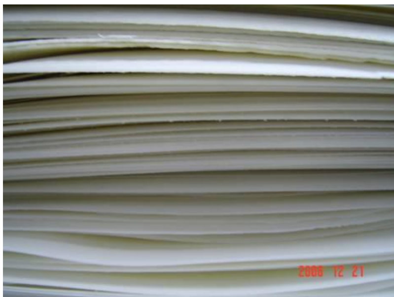
图五：所研制的聚丙烯发泡板材