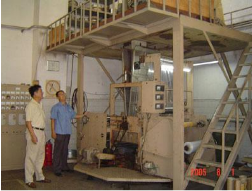
图二：研制的五层共挤下吹（水冷）高分子复合膜生产机组