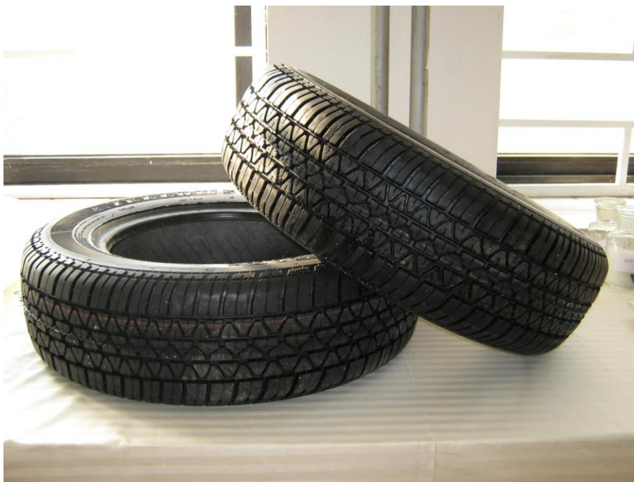
图九：用本研究丁苯橡胶/纳米层状硅酸盐乳液共沉胶生产的轮胎（青岛黄海橡胶集团）