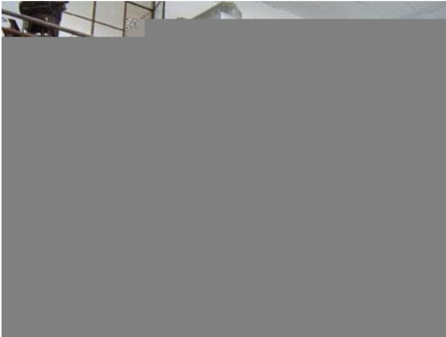
图七：2000 吨/年纳米层状硅酸盐生产装置

标志性成果四： 与中石化齐鲁石化橡胶厂合作开发的“丁苯橡胶/纳米层状硅酸盐乳液共沉胶”已完成工业化试验（国内首家），其成功不仅可产生巨大的经济效益（国内丁苯橡胶产量为 60 万吨），而且将有望彻底根除污染、节约石油等战略物资。见图七、八、九。